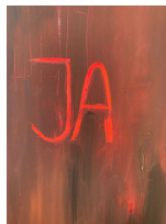
Angenommen